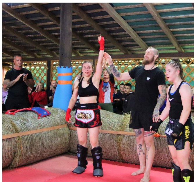
Spartak kickbox Nýrsko

houtovi. Celá akce trvala necelé tři hodiny a přišlo ji podpořit zhruba 200 diváků. Odpoledne doprovázel DJ KRTEK a moderátorka Kateřina Lang.