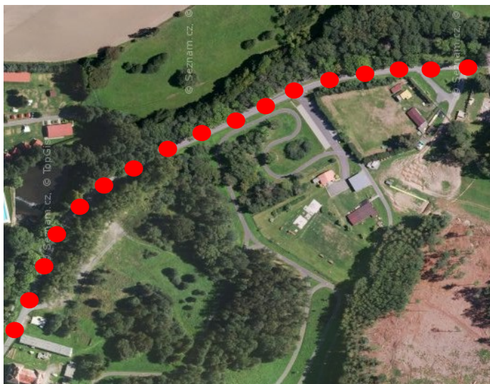
● úsek, na kterém bude probíhat rekonstrukce

Komunikace bude uzavřena 14. – 22. června.