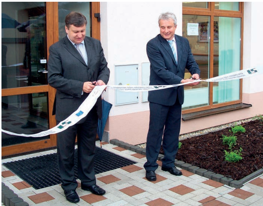
Slavnostní otevření zdravotního střediska v r. 2010

„Co mě zasáhlo, byly osobní útoky. Jsme na malém městě a vidíme si „do talíře“.