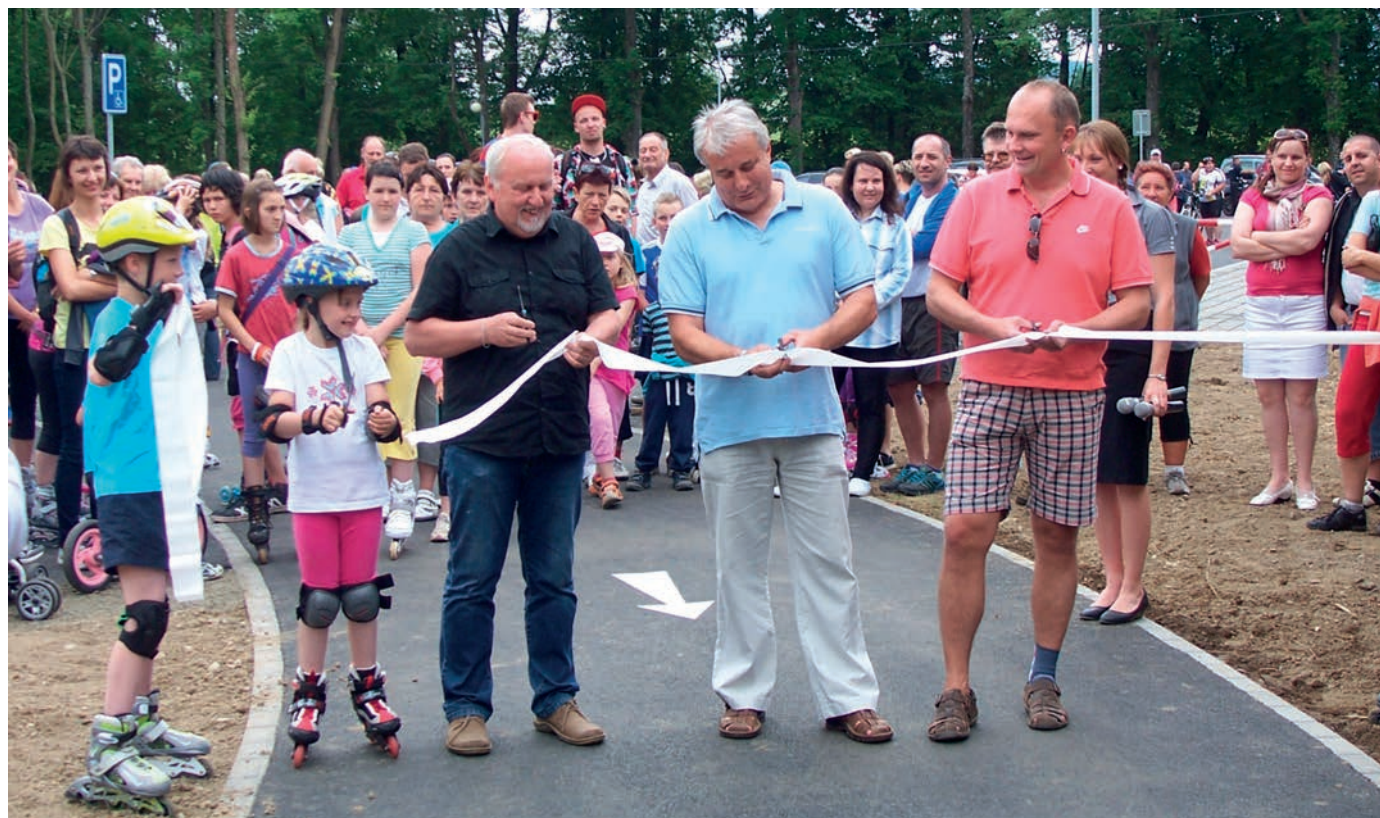
Slavnostní otevření inline dráhy v r. 2014

„Neměl jsem vůbec žádnou politickou ambici, spíš to byla víceméně náhoda. A tím, jak mě lidé znali, znají, znají naši rodinu, tak podle mého se v těch volbách k tomu tak postavili. A přestože jsem byl ve vedoucí funkci, které nejsou úplně u lidí oblíbené, tak už v té době jsem dostal poměrně dost hlasů.“