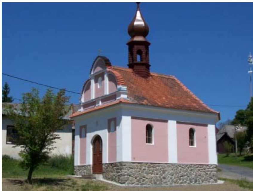
Kaple v Hodousicích