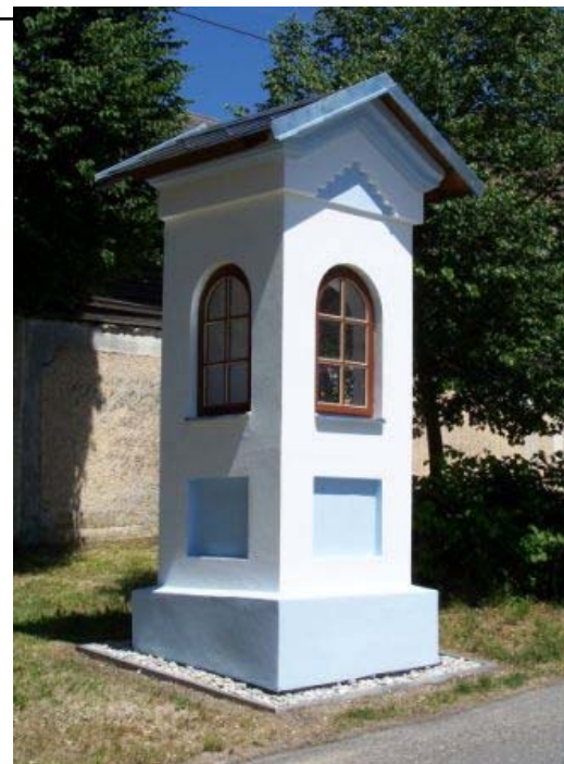
Boží muka v Bystřici nad Úhlavou