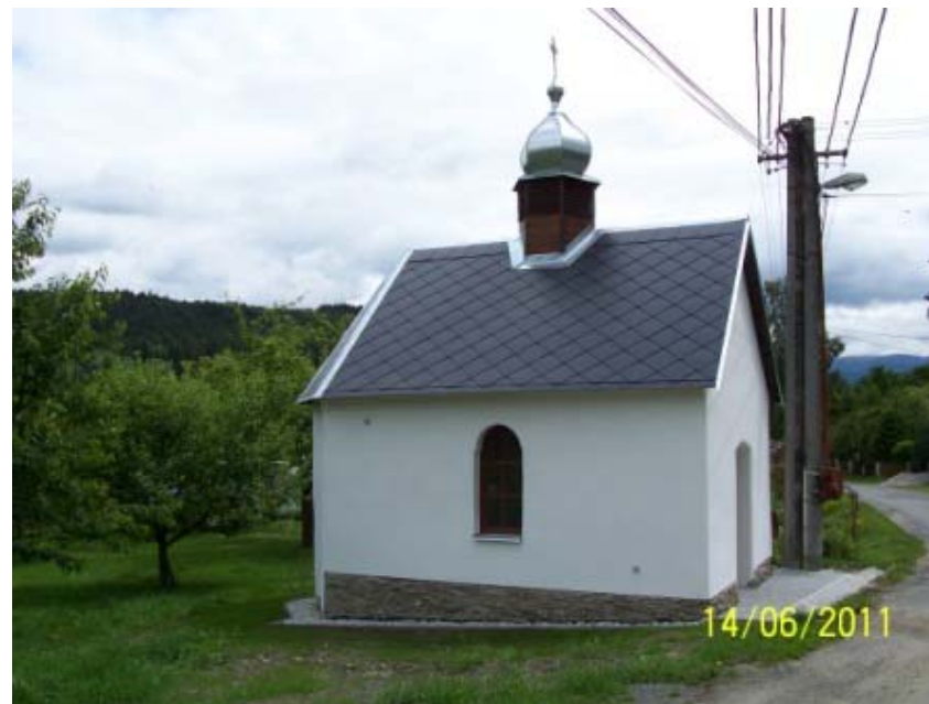
Kaple ve Staré Lhotě