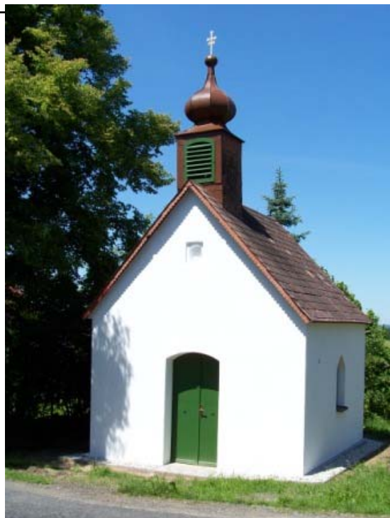
Kaple na Blatech